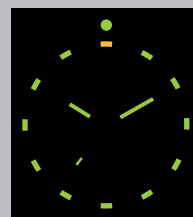
Titanium case, unidirectional rotating bezel, sapphire crystal, illuminated second hand.