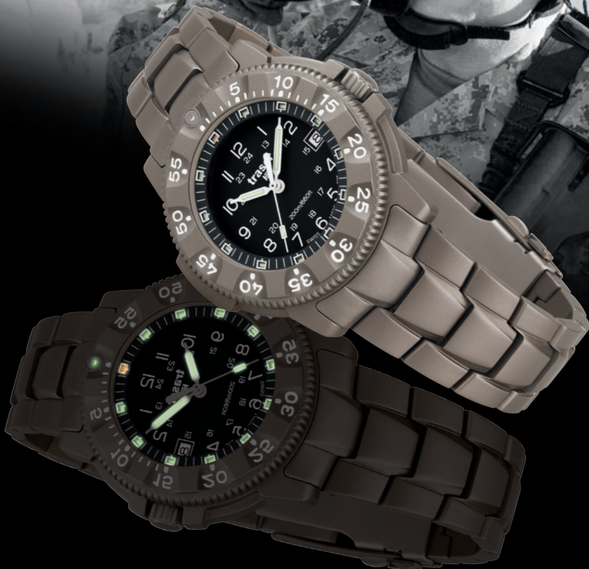
P 6506 Commander 100 Force

«I read my traser ® H3 watch in a blink of an eye»